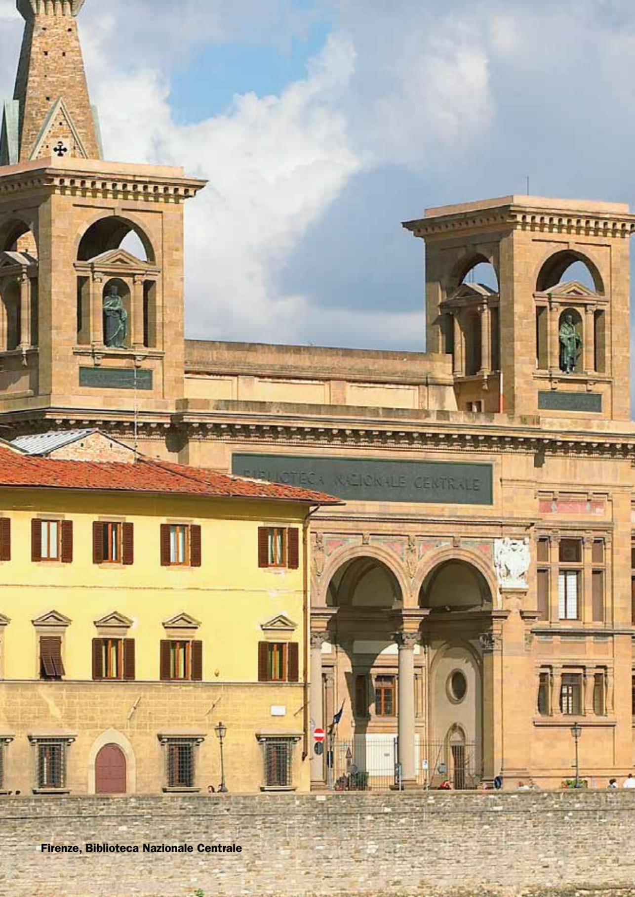
Firenze, Biblioteca Nazionale Centrale