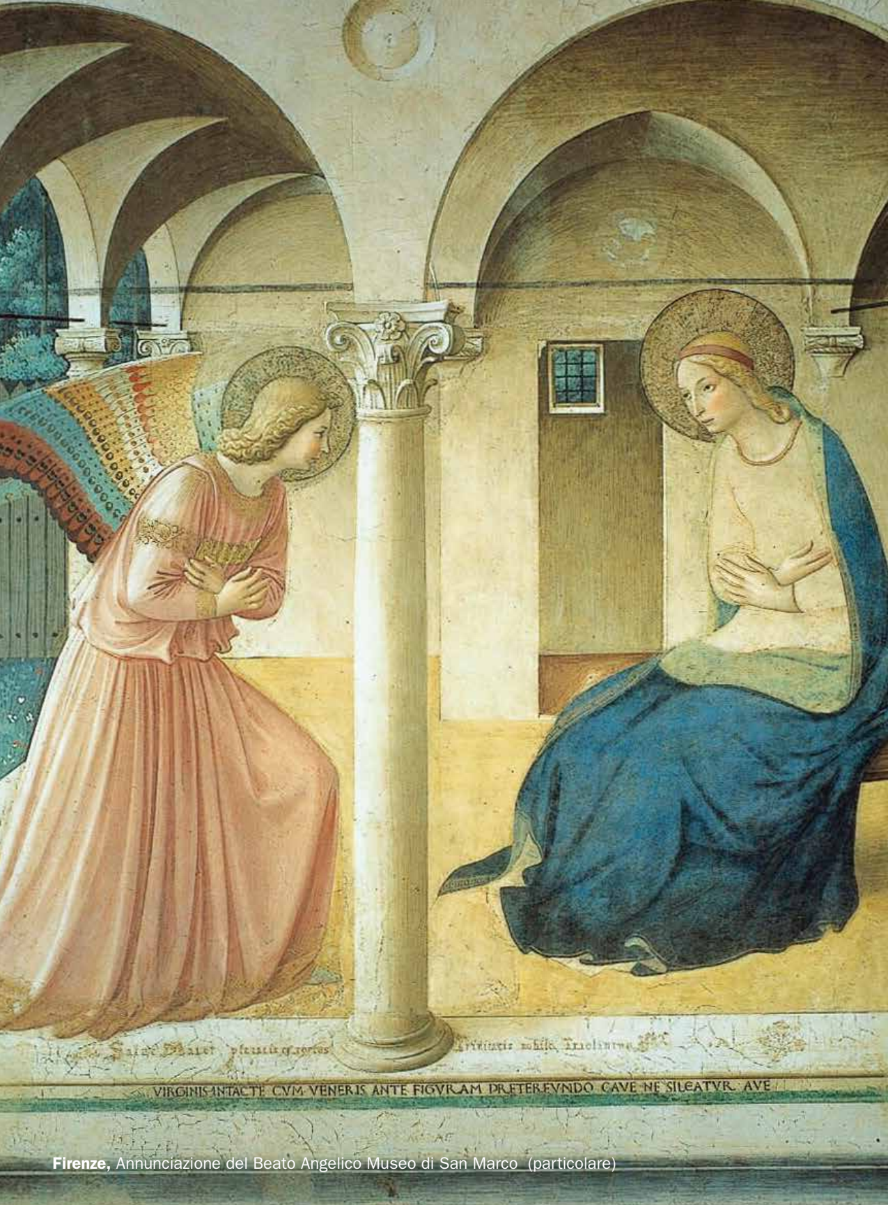
Firenze, Annunciazione del Beato Angelico Museo di San Marco (particolare)

CEDIT offre questi stessi servizi anche a giovani in formazione, lavoratori, imprenditori, funzionari della pubblica amministrazione e formatori italiani che intendono allargare i propri processi di sviluppo con un'esperienza presso altri Paesi dell'Unione Europea. Apparteniamo, infatti, ad una rete europea di organizzazioni similari e complementari che lavorano con la stessa metodologia di qualità in programmi di soggiorno ed interscambio. Le sedi principali di questa rete sono situate nel Regno Unito (Londra), Spagna (Siviglia), Francia (Bordeaux), Irlanda (Dublino), Germania (Stoccarda), Ungheria (Budapest), Austria (Vienna), Repubblica Ceca (Praga), Romania (Bucarest).