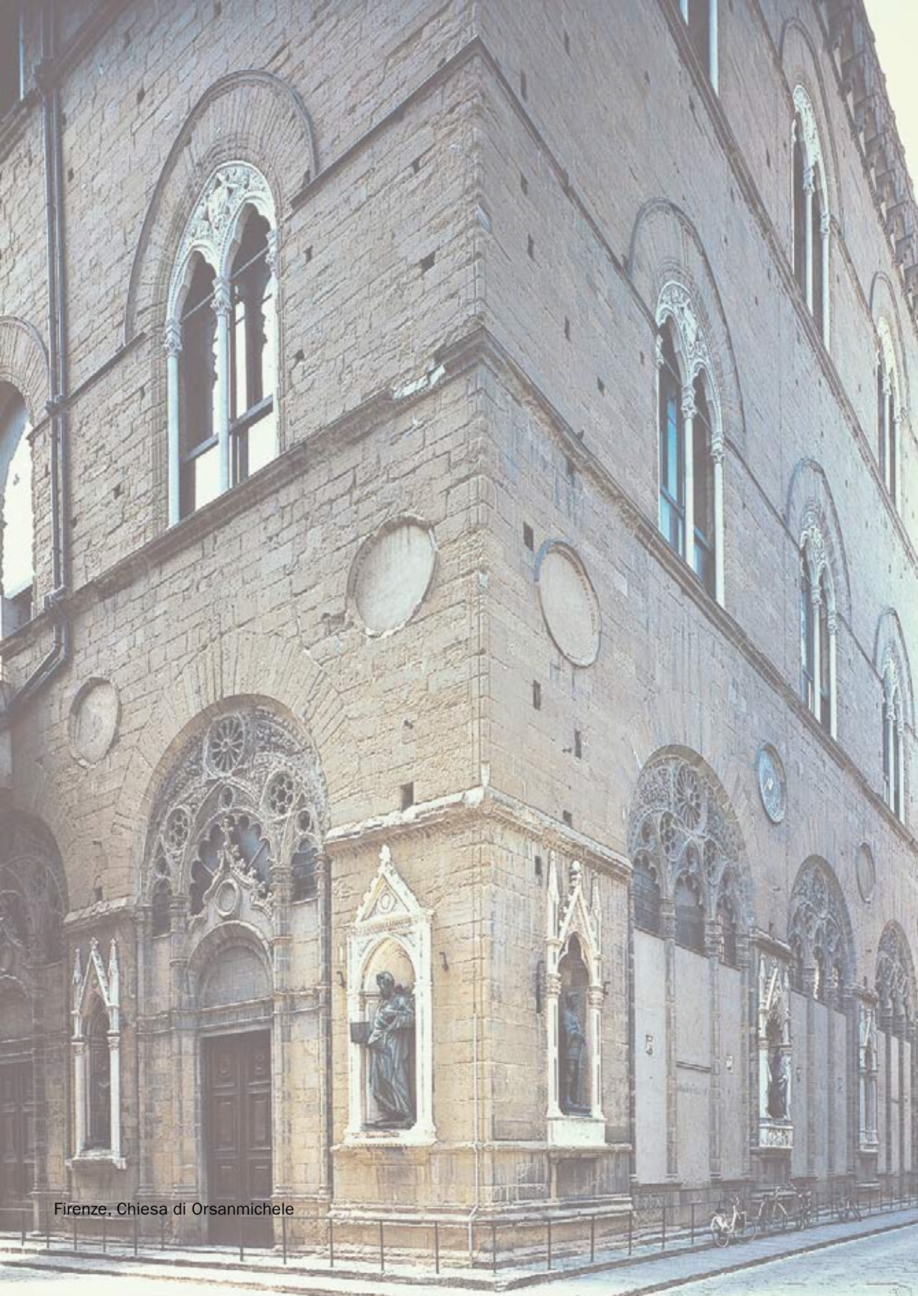
Firenze, Chiesa di Orsanmichele