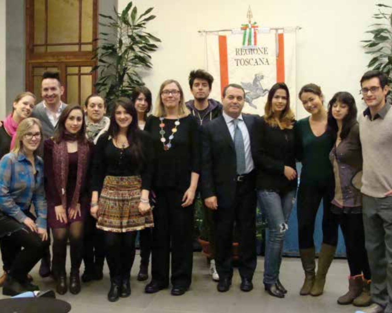
Ricevimento dei borsisti "Mario Olla" presso la Presidenza della Regione Toscana 24 gennaio 2014 - Palazzo Sacratì/Strozzi Sala Pegaso - Piazza Duomo, 10 Firenze